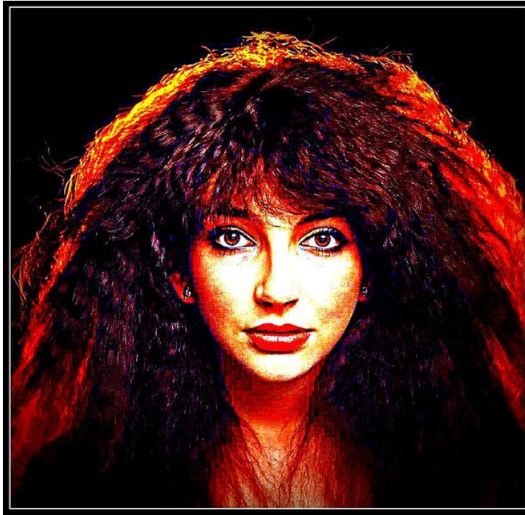
Kate Bush – puur artistiek genie... of iets meer sinisters?

Nadat ze tussen 1973 en 1978 naar verluidt ongeveer 120 nummers had geschreven steeg Kate naar grote hoogten na het uitbrengen van The Kick Inside (waar we op de hoes een half oog zien, en Kate in een soort positie van kruisiging, dus dat was meteen een goede start!) en de single Wuthering Heights (waarin ze de identiteit van een geest aanneemt; het is nou niet dat we geen subtiele aanwijzingen kregen van haar fascinatie met het bovennatuurlijke en het occulte) dat werd vergezeld door twee promotionele video's. Terwijl de in een studio gefilmde versie, waarin ze danst in een witte ballerinajurk, de bekendste is, is de versie waar ze buiten in een rode jurk danst iconisch geworden onder fans.