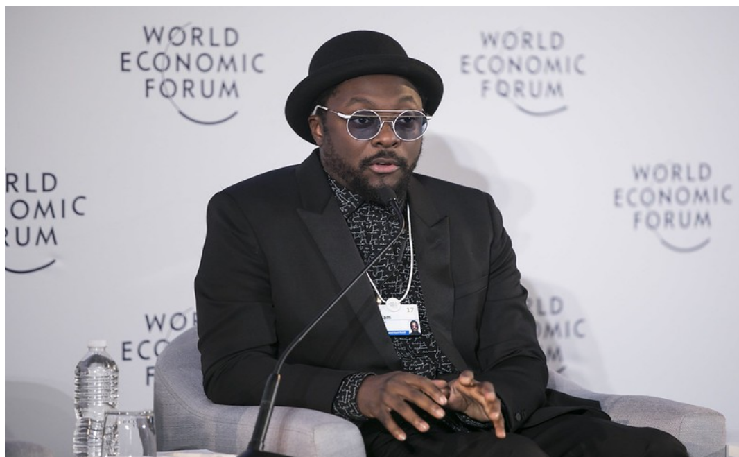
Wil.I.Am, lokvogel voor zijn meesters bij het World Economic Forum.

te bespreken welke gemeenschap veranderende maatregelen ze willen inleiden om hun eigen belangen en de voortgang van de agenda's voor een Nieuwe Wereldorde te dienen.