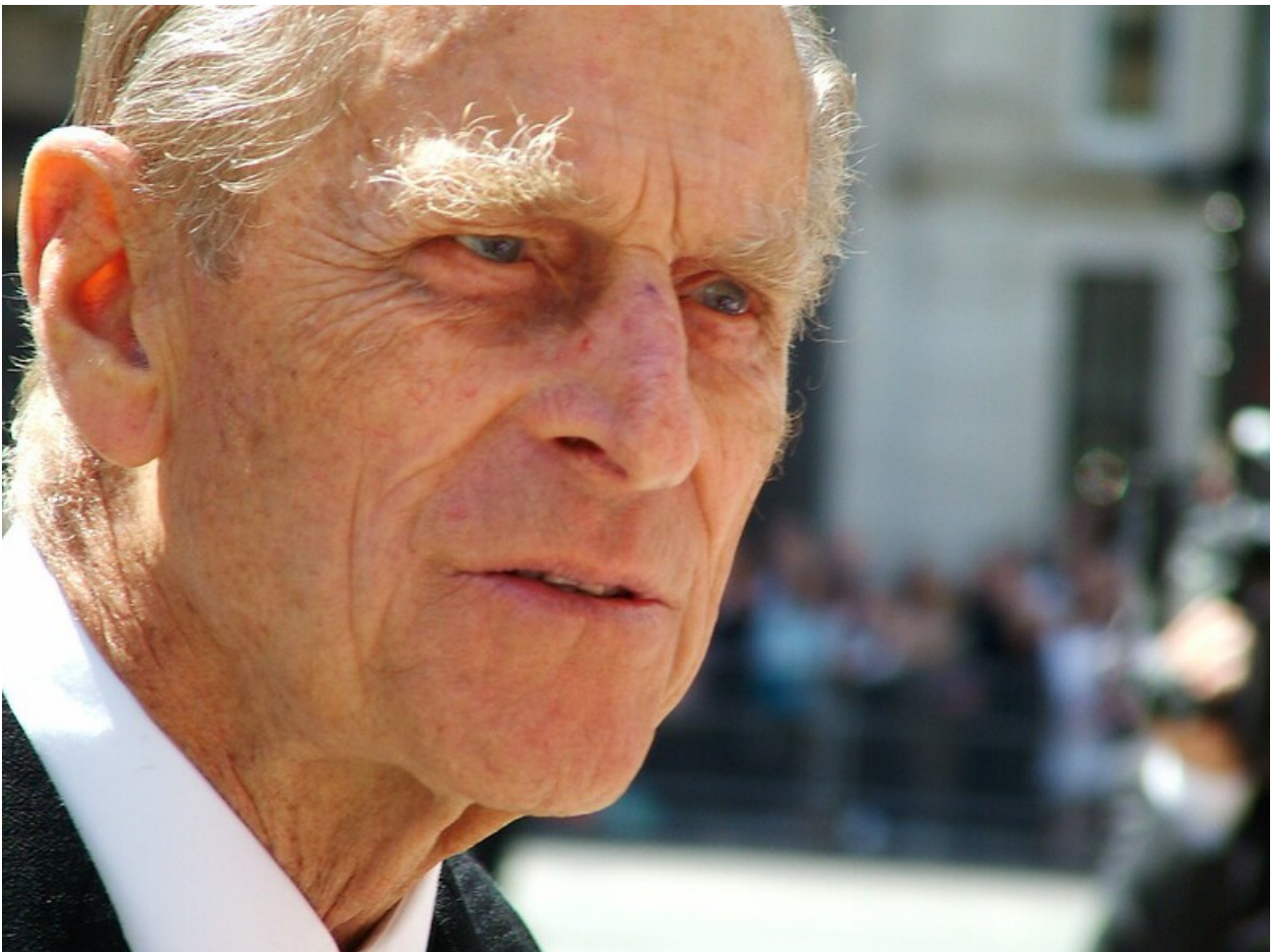
Prins Philip. Altijd al het meest vooraanstaande lid van de Club van de Blauwe Ogen.

Vanaf 2018 werd het aantal “beroemdheden” en andere bekenden die in het openbaar verschenen met een donkere rand om een oog, alsof iemand ze een “blauw oog” had geslagen, een punt van discussie. De meest voor de hand liggende kandidaat was prins Philip die verschillende keren werd gefotografeerd met een blauw oog, meestal het rechter maar soms allebei. En toch werd dit nooit opgepakt door de mainstream pers die, in de stijl van De Nieuwe Klaren van de Keizer , deed alsof het volkomen normaal was dat hij zo verscheen, en geen reden zag enige vraag hierover te stellen. Volgens ingewijden is het verschijnsel van een “blauw oog” een bijeffect van de onthouding van het gebruik van Adrenochroom.