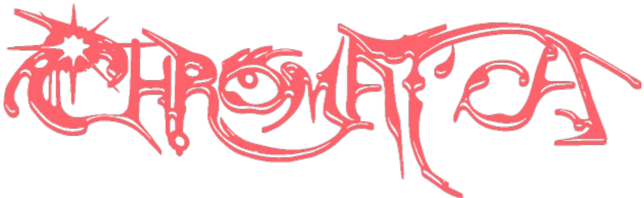
Het logo op de hoes van Chromatica . Niets te zien hier, gewoon doorlopen.

Gaga had Free Woman voorgesteld als voorlopige werktitel vanwege haar genegenheid voor het nummer van het album met die naam, maar haar interne strubbelingen deden haar twijfelen aan de integriteit van de voorgestelde titel. Daarom koos ze in plaats daarvan Chromatica... het product van haar idee van een ver weg gelegen, fantastische planeet waar onderling strijdende stammen samenkomen om te helen en vrede te sluiten door dans. Gaga beschrijft de synthese van kleur en geluid als het raamwerk voor planeet Chromatica en haar gedeelde visie met BloodPop.