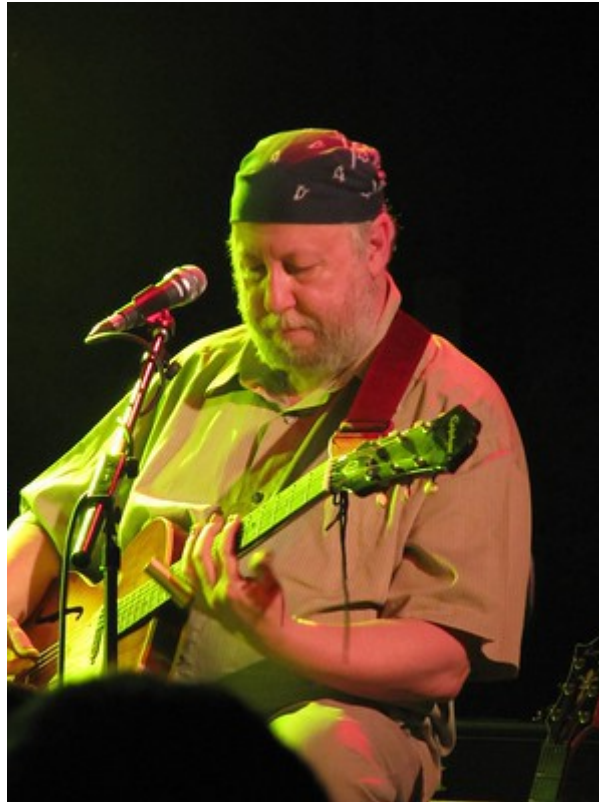
De legendarische gitarist van Fleetwood Mac die in 2020 overleed. Zijn verhaal toont vele parallellen met dat van Pink Floyds Syd Barrett.

schizofrenie en bracht lange tijd door in psychiatrische ziekenhuizen waar hij behandeld werd met elektrische schokken (waarvan is bericht dat dit werd toegepast bij experimenten in programma's voor op trauma gebaseerde geestbeheersing, gelijkend op MK-ULTRA) gedurende de jaren 1970'. Vrienden hebben verteld dat hij bijna voortdurend in een staat van trance leek te zijn.