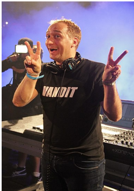
De Duitse DJ/producer Paul van Dyk, internationaal ambassadeur voor “Trance.” Ach, wat zegt een naam nou...