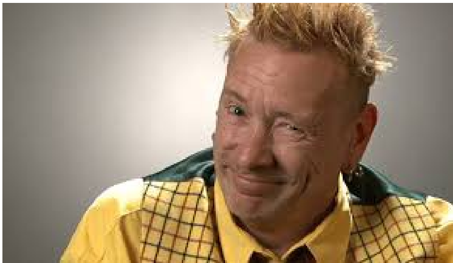
John Lydon. Een meesterwerk van een handgemaakt raadsel.